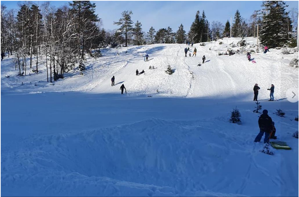
Bilde av gapahuk og grillhytte ved akebakken.